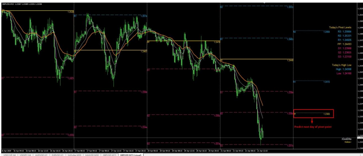
(Рисунок 2: отображает прогноз цены на ближайший день.)