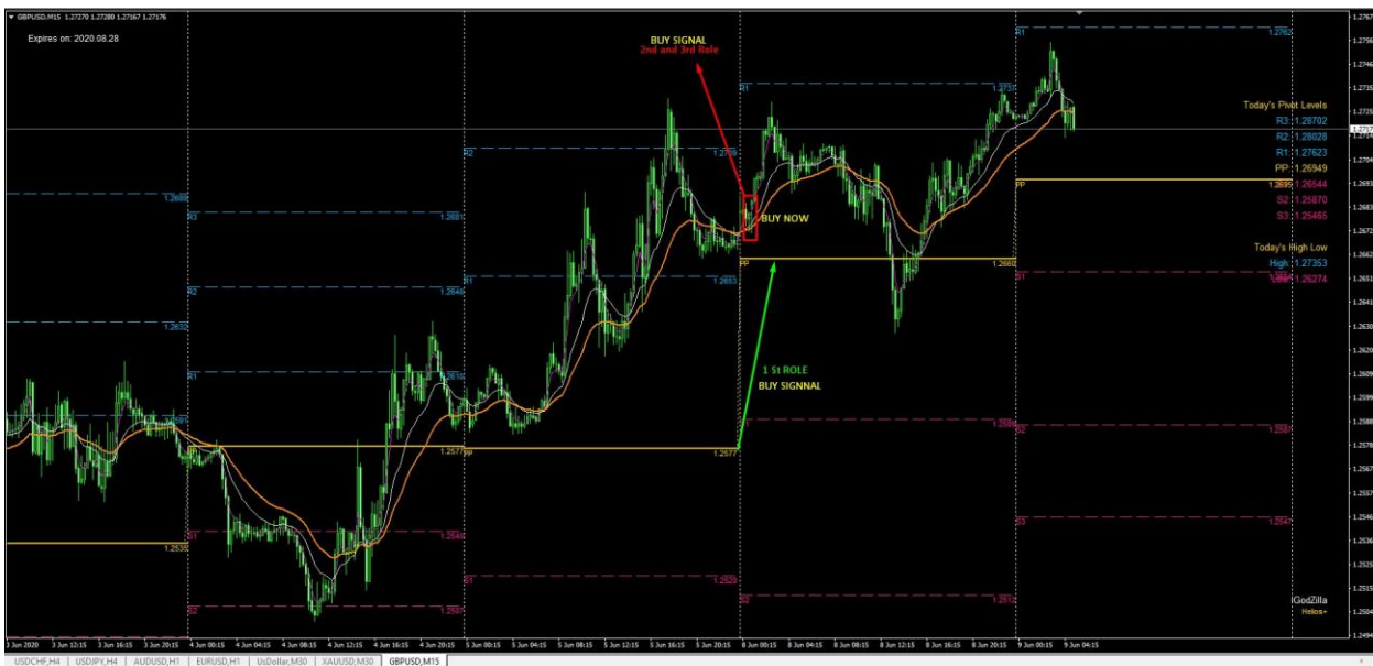
(Рисунок 3: Вход КУПИТЬ с iGodZilla.)