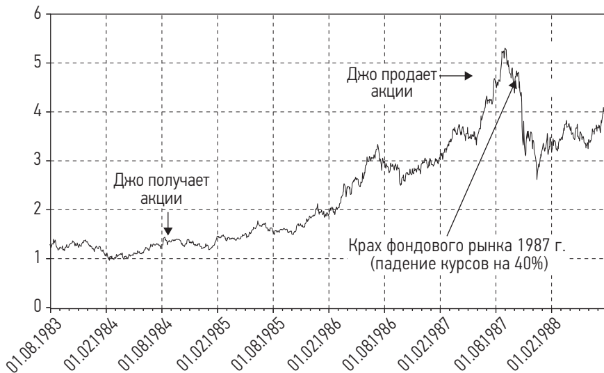
Рис. 1.1. Бурный рост и резкое падение курса акций Wal-Mart, 1983–1988 гг.